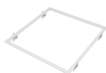
Einbaurahmen für 595x595 analog für 1195x295